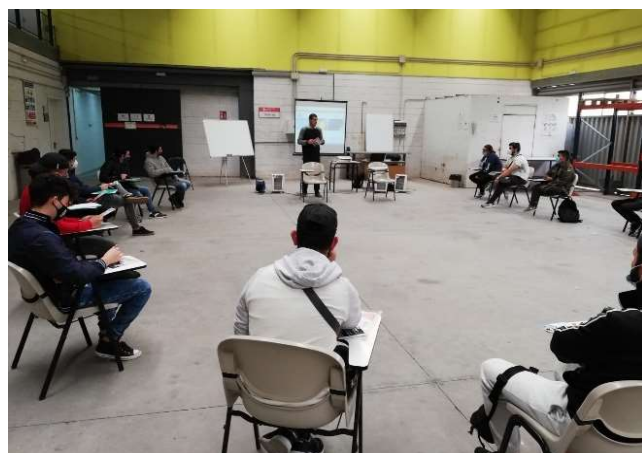
Pilottest i Andalusien (Spanien)