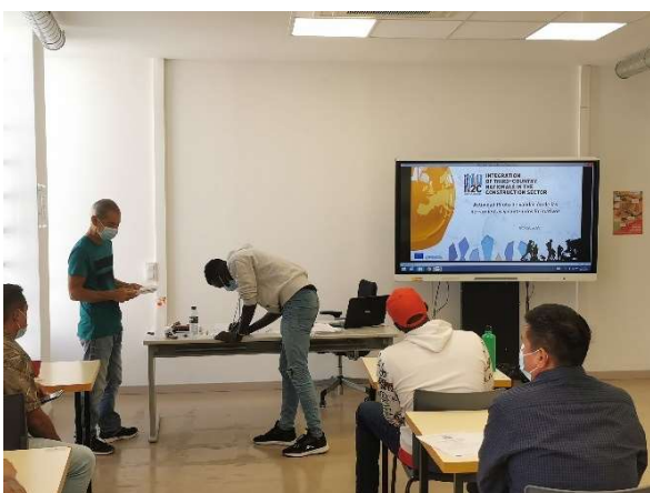
Pilottest på Kanarieöarna (Spanien)