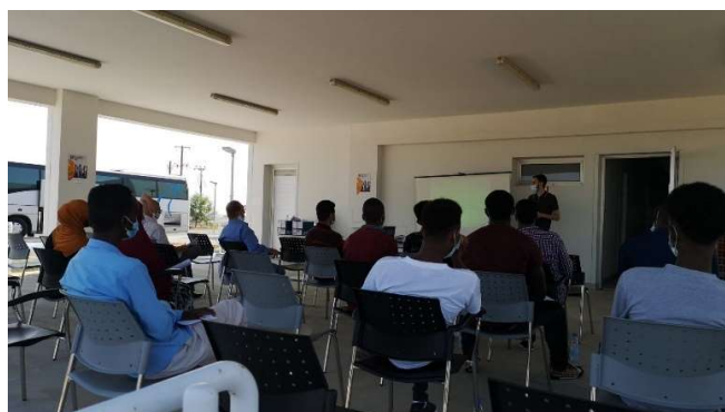
In2C-utbildning på Cypern