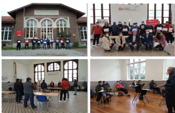
Bilder från pilottest av utbildning i Kantabrien (Spanien)

Nedan visas några bilder från pilottesterna av In2C-utbildningarna i Spanien (Kantabrien, Andalusien och Kanarieöarna) och på Cypern: