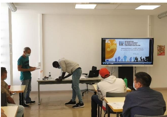
Formación piloto realizada en las Islas Canarias (España)