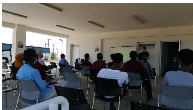
Formación piloto realizada en Chipre.