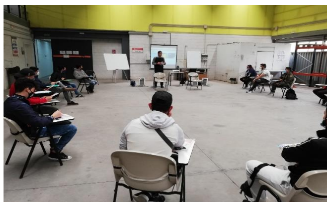
Formación piloto desarrollada en Andalucía (España)