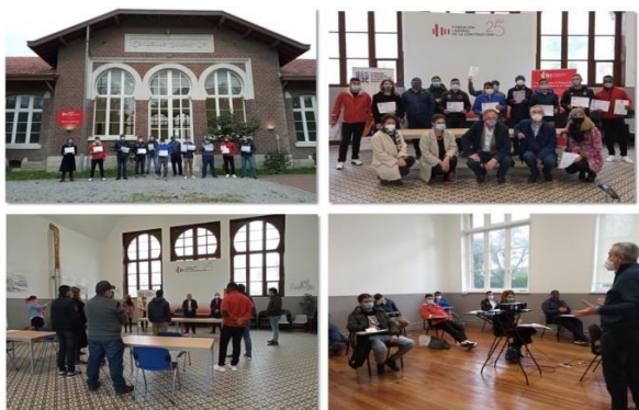
Formaciones piloto desarrolladas en Cantabria (España)

A continuación se muestran algunas imágenes de las formaciones piloto desarrolladas en el marco del proyecto In2C en España (Cantabria, Andalucía y Canarias) y Chipre: